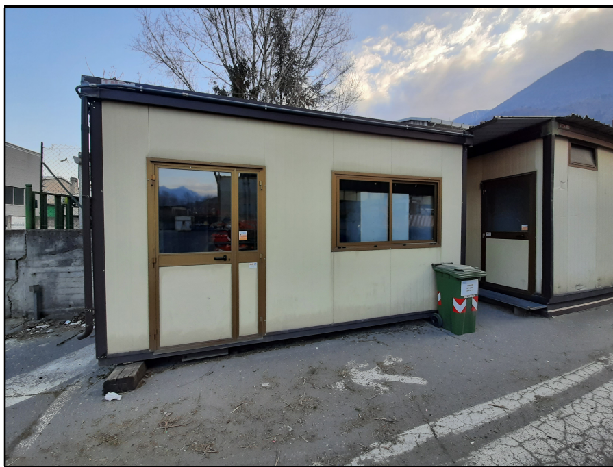
A - Box adibito a magazzino vestiario - (Sup. totale mq. 11,30)