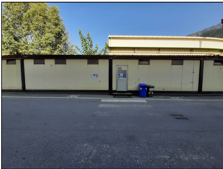
A - Box adibiti a spogliatoi, servizi igienici ed area break - (Sup. totale mq. 68,55)