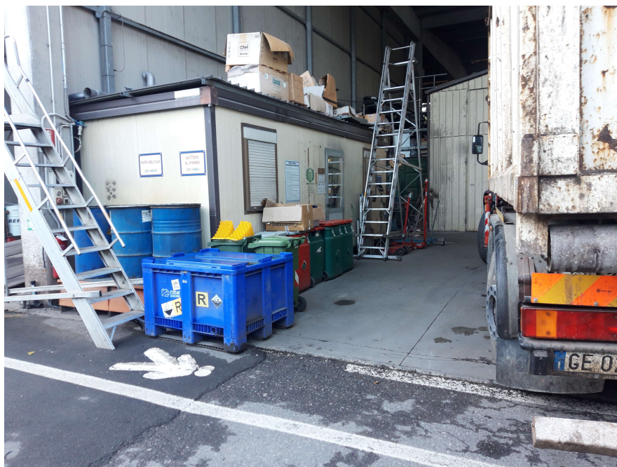
B - Box adibito a ufficio e magazzino officina meccanica - (Sup. totale mq. 16,80)