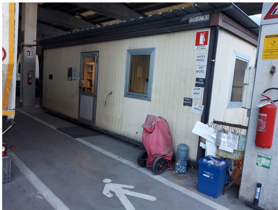
C - Box adibito a ufficio e magazzino officina meccanica - (Sup. totale mq. 17,75)